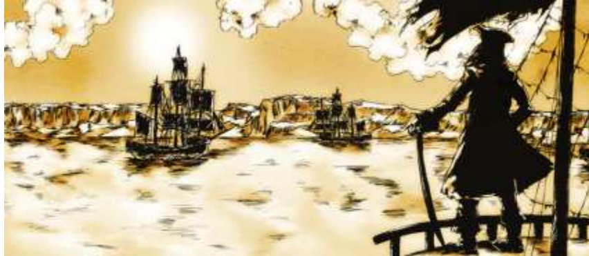
Illustration numéro 1