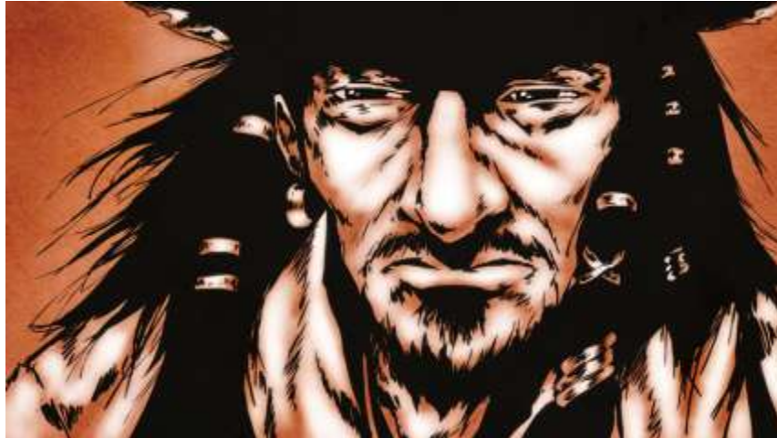
Illustration numéro 2