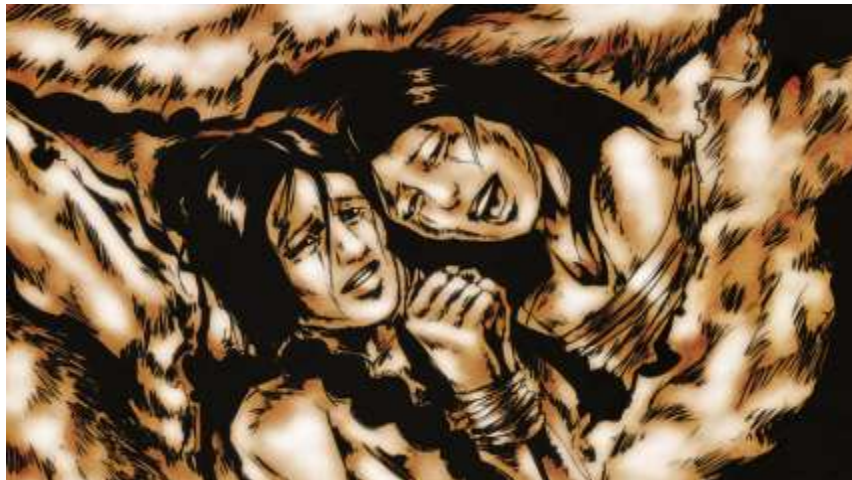
Illustration numéro 3