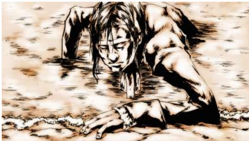
Illustration numéro 5