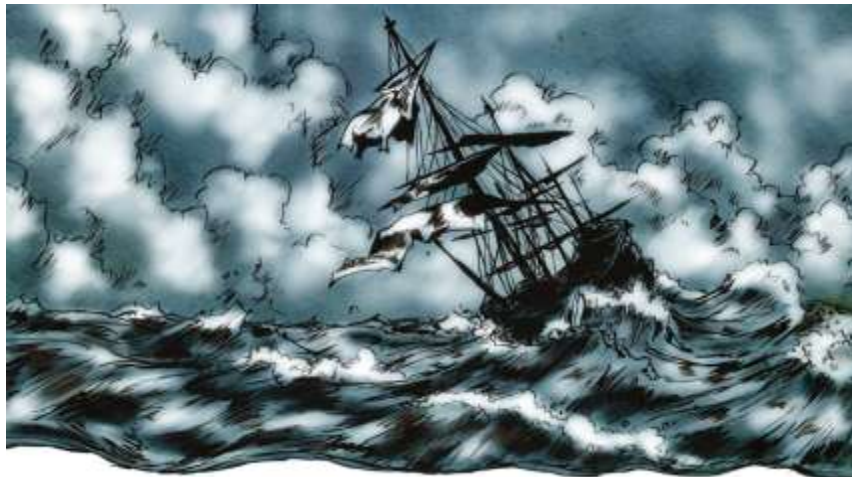
Illustration numéro 4